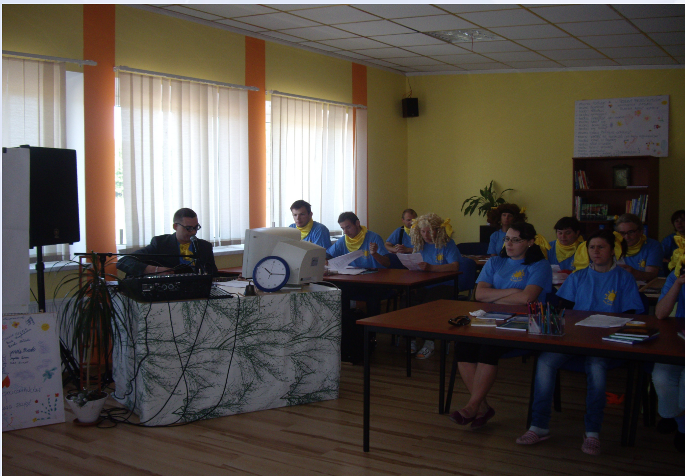
Przedstawienie z okazji Dnia Matki