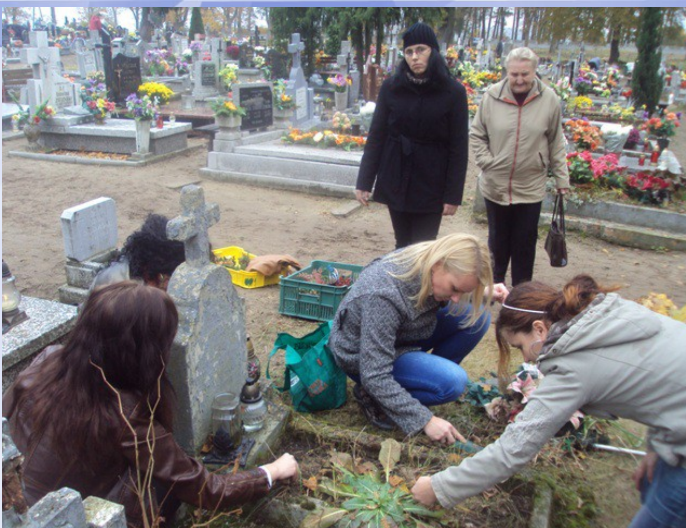
Porządkowanie grobów przed 1 Listopada