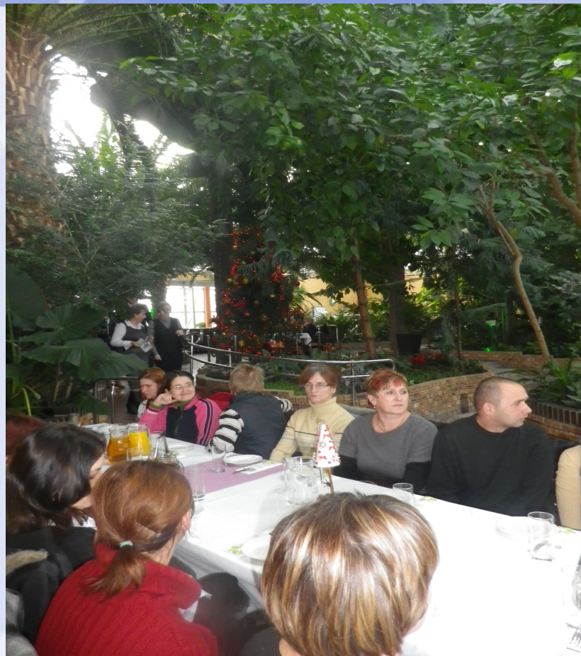
Realizacja projektu pn. „Aktywna integracja prowadzona przez OPS w Cybince” - spotkanie w Palmiarni w Zielonej Górze