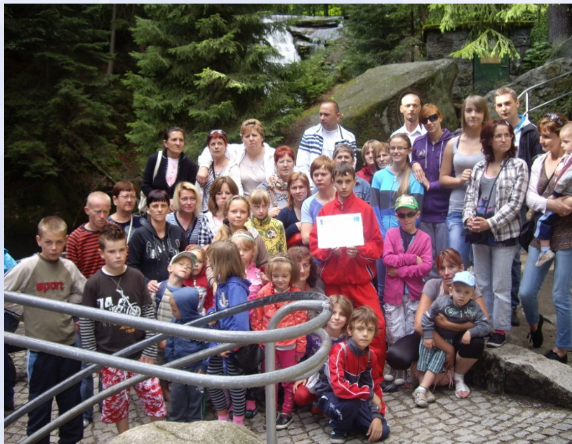
Realizacja projektu pn. „Aktywna integracja prowadzona przez OPS w Cybince”- wyjazd do Świeradowa Zdroju