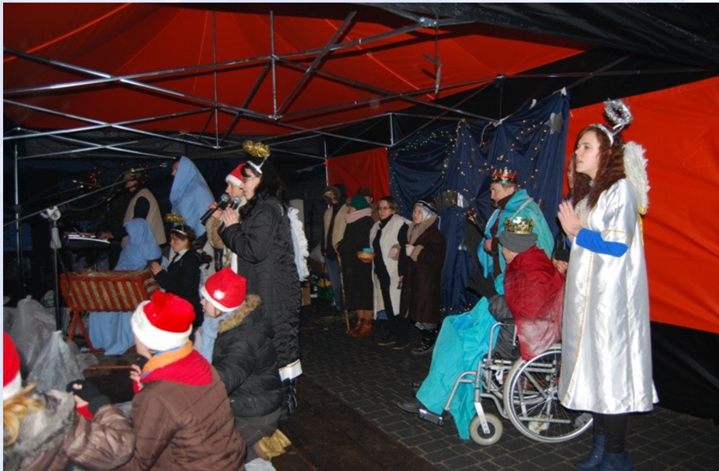
Wigilia Plenerowa 2012 – Jasełka w wykonaniu uczestników i pracowników ŚDS „Pod Słońcem” w Bieganowie