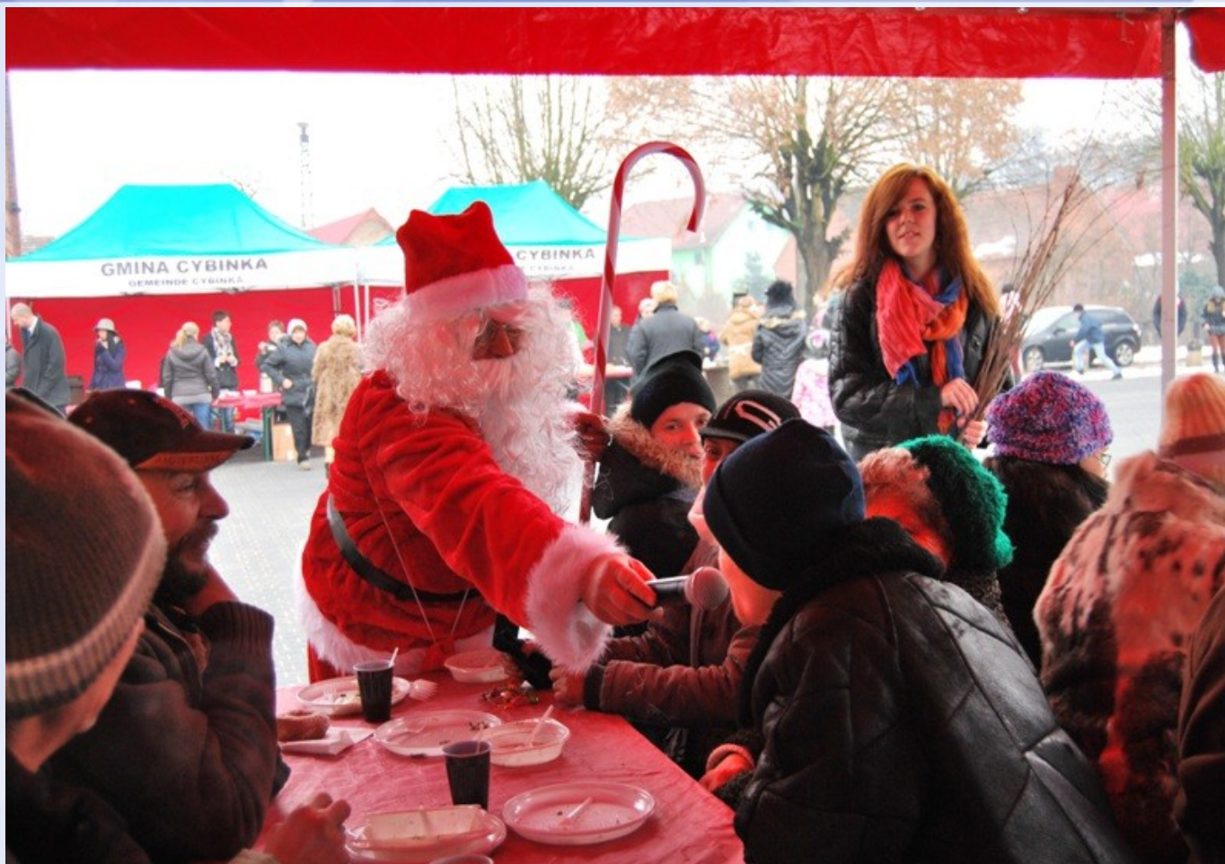
Wigilia Plenerowa 2012