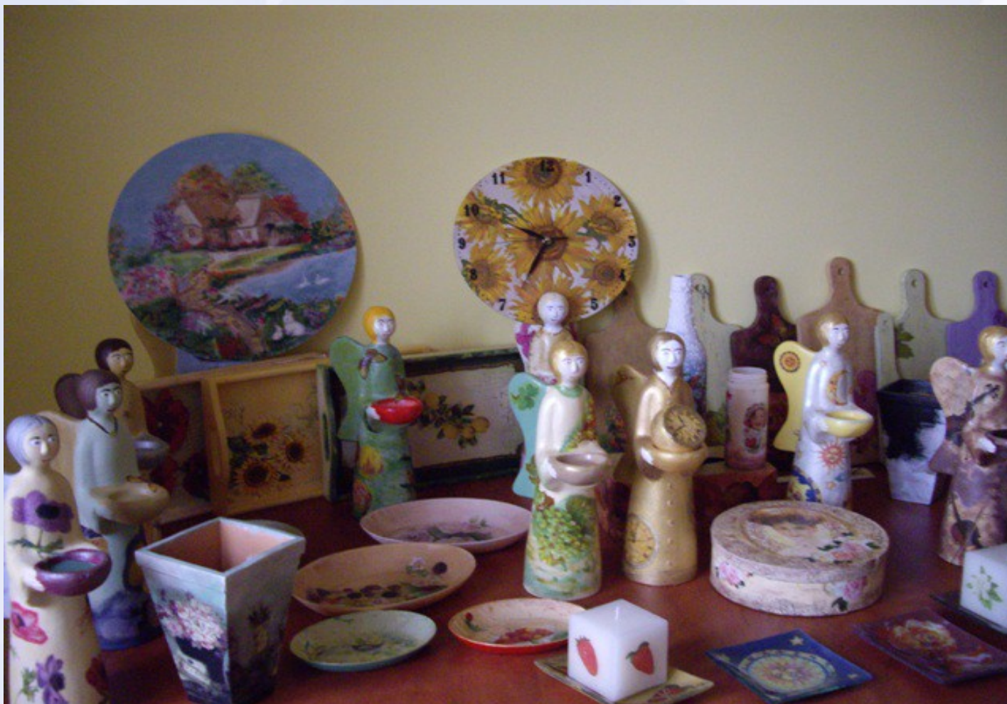
Prace wykonane przez uczestników