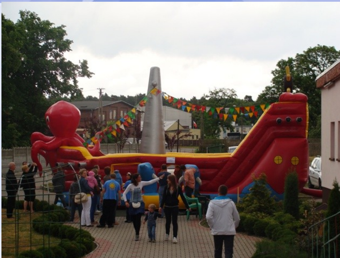
Realizacja projektu pn. „Aktywna integracja prowadzona przez OPS w Cybince” - Dzień Dziecka