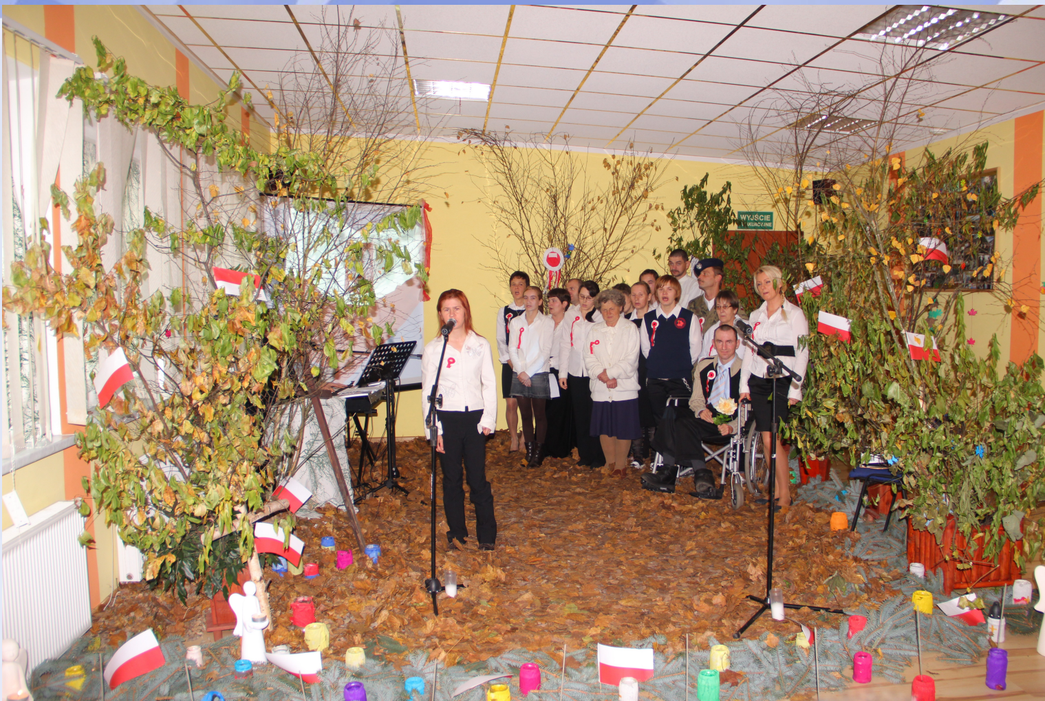
Przedstawienie z okazji Święta Niepodległości