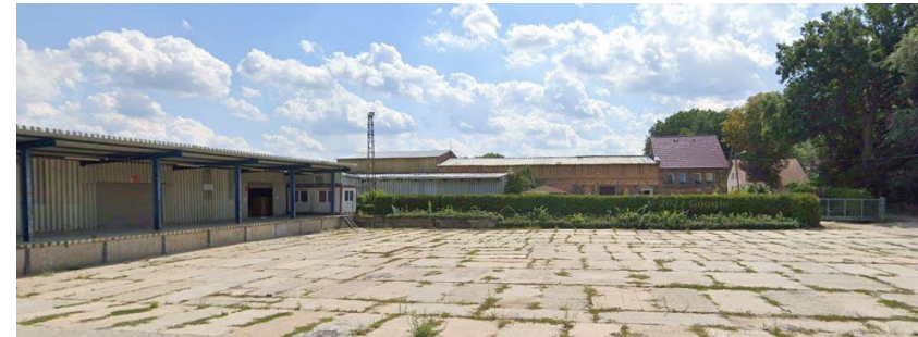
zdjęcie od strony ulicy z widokiem na folwark i kolonię mieszkalną

Historyczna zabudowa folwarczna nie istnieje, ale układ dawnego folwarku zachowany i nadal czytelny. Zagrożenia dla wartości historycznych stanowi przebudowa układu. Zabudowa kolonii mieszkalnej częściowo zachowana. Zagrożenie stanowi jej rozebranie i wprowadzanie do zachowanych obiektów wtórnych przybudówek o dysharmonizującej formie, wymiana zachowanej stolarki na współczesną bez zachowania historycznej formy, adaptacja bez zachowania historycznej formy. Postuluje się utrzymanie w jak najlepszym stanie zachowanych, historycznych wartości obiektów.